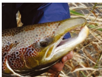
Losos ulovený na udici v prosinci 2020 na soutoku Kamenice a Labe.

zatím vzhledem k nouzovému stavu a vládním nařízením (pondělí a středa 9.00 – 14.00).