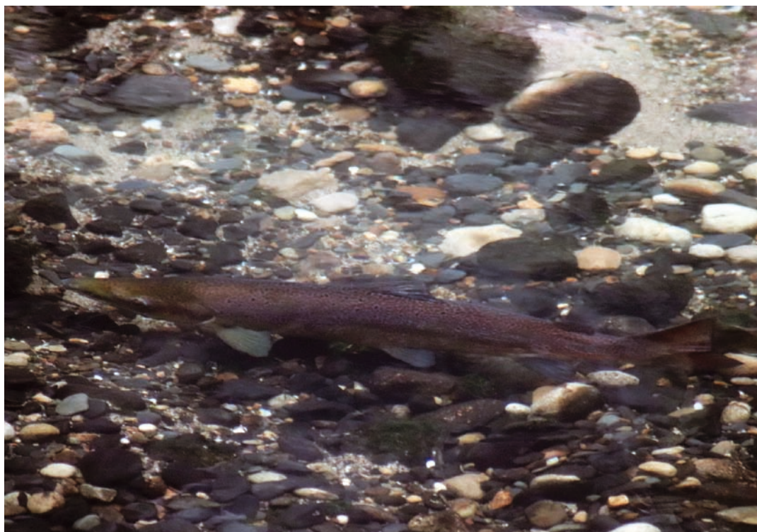
Jeden z lososů na trdlišti v Edmundově soutěsce, prosinec 2020.

Není možné spolehlivě říci, čím přesně je změna v chování ryb způsobena. Nepochybně si však vyžádá i úpravu opatření, která mají za cíl lososy chránit. Stále se totiž jedná o vzácný druh, na který se vztahuje vyšší ochrana. Dosud lososy chránilo zejména omezení rybolovu v okolí soutoku Kamenice a Labe, které však nyní končí vždy k poslednímu listopadovému dni. Loni i letos se tak řada lososů musela utkat s rybáři, kteří v oblasti soutoku