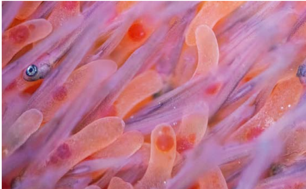
Váčkový plůdek lososa obecného v plovoucí inkubační schránce umístěné v Jetřichovické Bělé.

„půlročků“ na podzim, jsou sice nadále uplatňovány, ale v menší míře, aby si rybky vzájemně potravně nekonkurovaly.