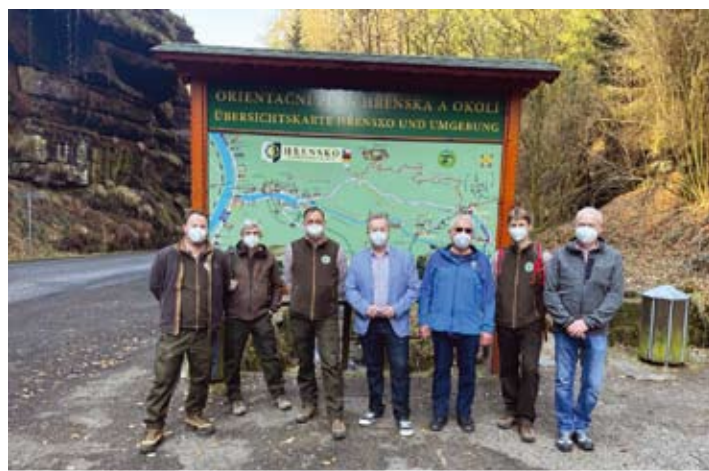
Otevření Edmundovy soutěsky za účasti ministra životního prostředí Mgr. Richarda Brabce.