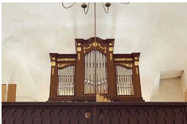
Očekávaná podoba zrekonstruovaných varhan ve hřenském kostele.