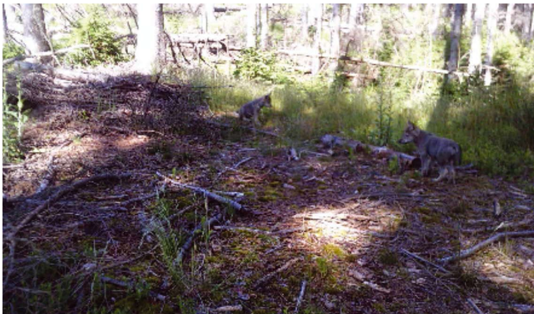
Dvě ze tří vlčích mláďat tak, jak je zachytila fotopast České zemědělské univerzity. Video můžete shlédnout na internetu pod odkazem: https://youtu.be/LoWHwocRAo8

Vlci se do Národního parku České Švýcarsko vrátili v roce 2016. Reprodukce vlků na území národního parku však byla potvrzena poprvé letos. Vlčí populace na území dnešního Českého Švýcarska byla člověkem vyhubena nejpozději v roce 1756, kdy měl být na území českokamenického panství odstřelen poslední jedinec. K potvrzené reprodukci vlků v Českém Švýcarsku tak došlo po 265 letech.