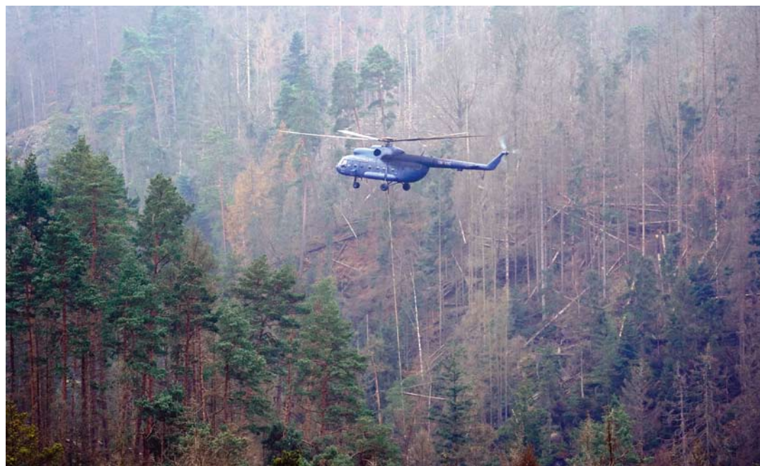
Vrtulník MI-8 při práci nad soutěskou Obere Schleuse na říčce Křinici.

prozatím provedeny pouze na české straně soutěsky, na straně německé mají proběhnout počátkem ledna.