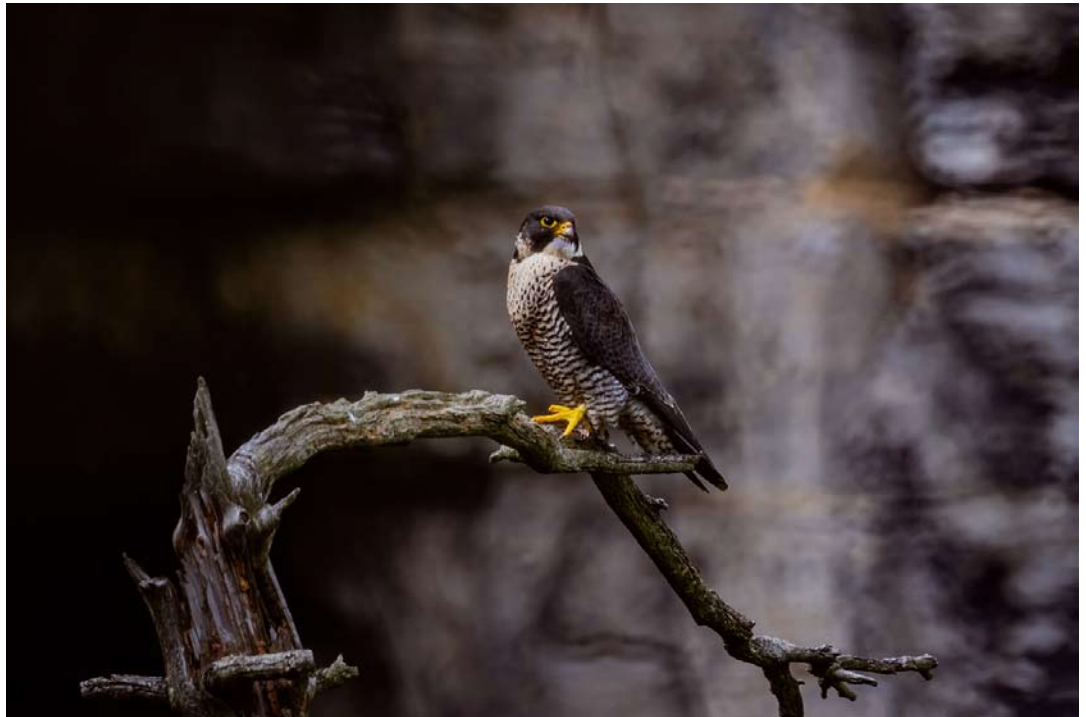
Sokol stěhovavý v blízkosti hnízda.

Omezení vstupu do hnízdních lokalit se nedotkne značených turistických cest, částečně však omezí využívání některých lezeckých objektů a případně některých neznačených lesních