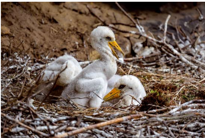
Mláďata čápů černých na hnízdě.

Správa národního parku děkuje za dodržování tohoto nezbytného opatření!