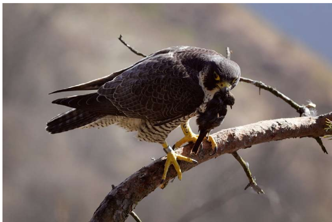
Samička sokola stěhovavého s kořistí, Národní přírodní rezervace Kaňon Labe.

také nachází těžiště české sokolů populace.