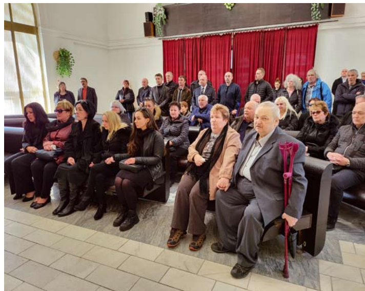
Poslední rozloučení proběhlo 23.3.2022 na Folknářích.