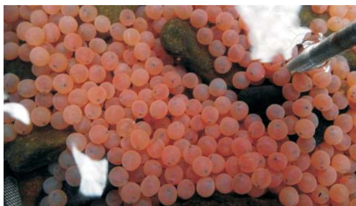
Jikry lososů obecných: První fáze svého vývoje jikry prodělaly v líhni v německém Langburkersdorfu. Nyní, ve stádiu očních bodů (oči rybičky jsou znatelné jako tmavý bod v jikře) byly vloženy do inkubačních schránek a umístěny do Kamenice.

Správa národního parku České Švýcarsko do reintrodukce lososů obecných zapojuje také veřejnost. V rámci programu nazvaného Návrat lososů umožňuje mimo jiné adopce malých lososů zasláním dárcovských SMS. Adoptivní rodiče si pak na podzim mohou „své“ lososy přijít i vypustit. Zájemci najdou podrobnosti na www.navratlososu.cz .