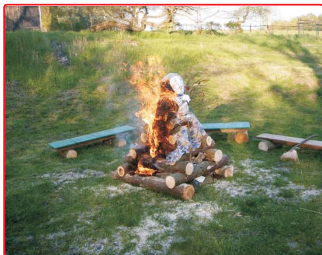
čarodějnice na Mezné - str. 10