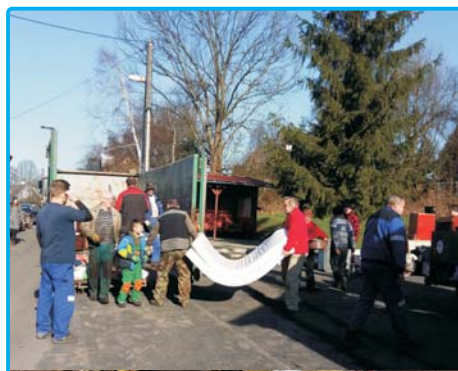
svoz nebezpečného odpadu - str. 5