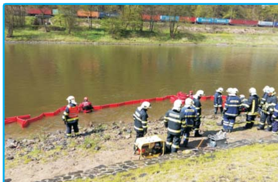
norná stěna na Labi - str. 6 a 7