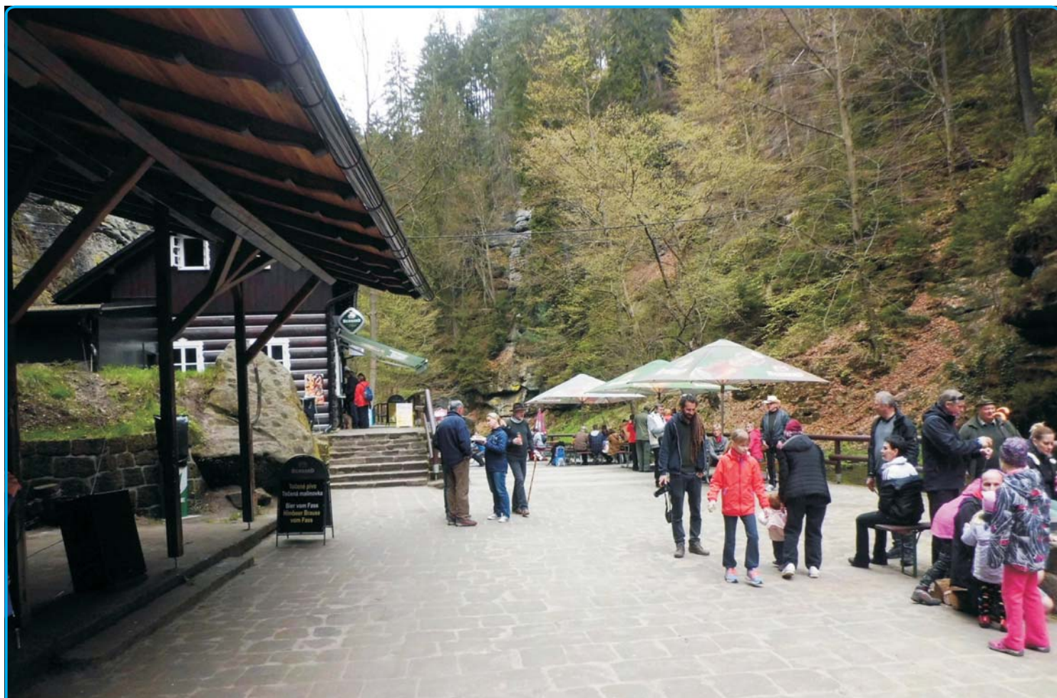
zahájení turistické sezóny - str. 4